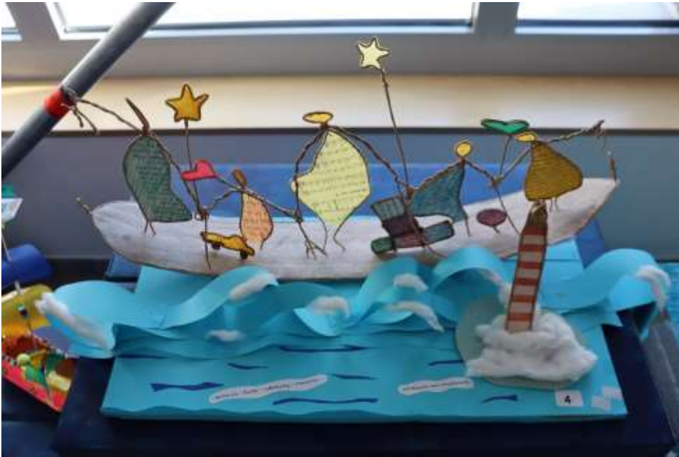
«Luce» vom Team Päd. Therapien (PMT)