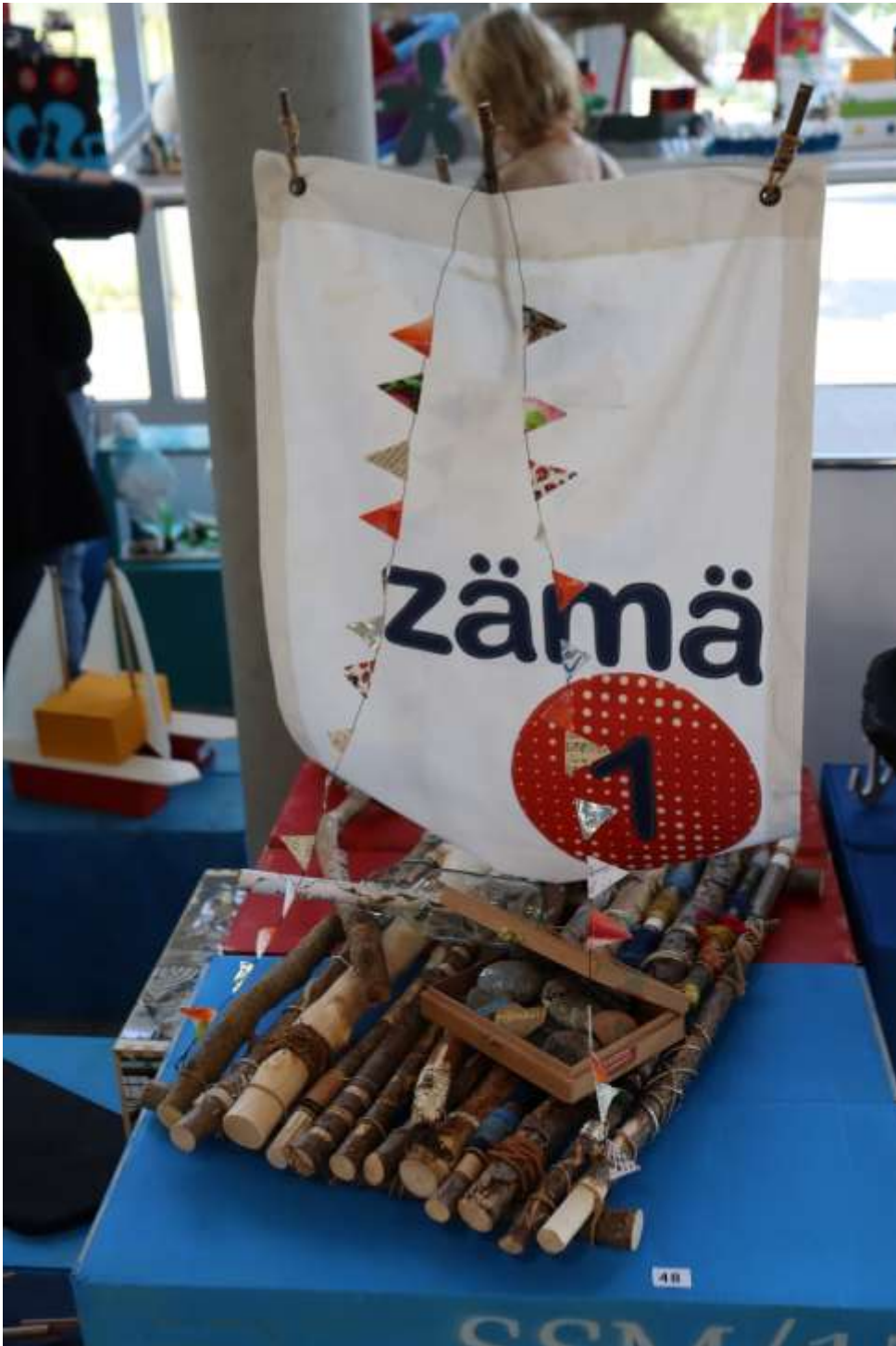
Siegerschiff «zämä1» vom Team Werkstätten WS 1