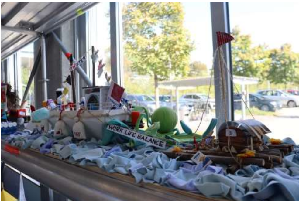
«Twister» vom Team Hauswirtschaft