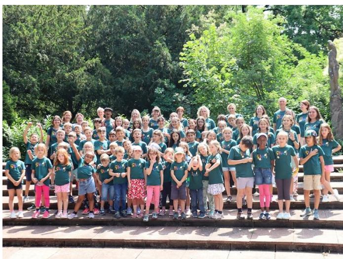
Schülerinnen und Schüler der Kooperativen Schule Stiftung Schürmatt und Primarschule Densbüren