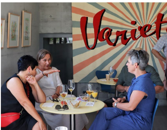
Die Gäste beim späteren Apéro.

Weitere Bilder auf unserer Website: https://www.schuermatt.ch/de/medien/