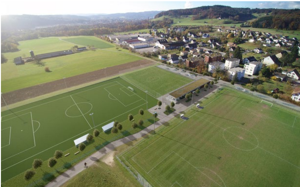
Fussballplatz in Erlinsbach SO

Das HZWB in Othmarsingen: Das Heilpädagogische Zentrum für Werkstufe und Berufsvorbereitung (HZWB) in Othmarsingen bereitet Jugendliche mit einer kognitiven Beeinträchtigung auf eine berufliche Ausbildung vor. Oberstes Ziel ist die individuelle passende Anschlussmöglichkeit in der Berufswelt und damit verbunden die grösstmögliche, selbständige Teilhabe am Leben in der Gesellschaft.